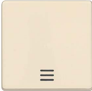
DELTA i-system elektroweiß Wippe mit Fenster 55x55mm